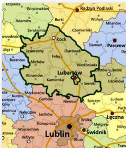
Mapa. 1. Mapa obszaru LGD